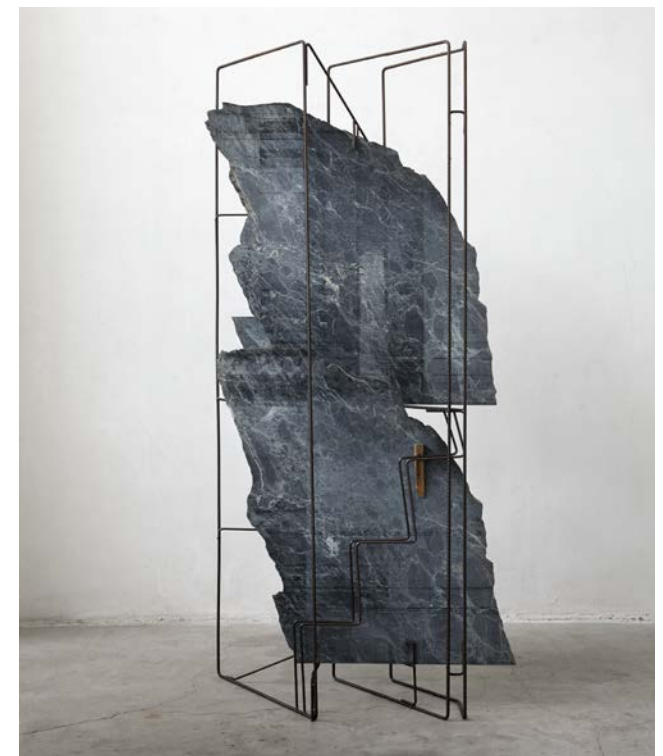
6 s.t. (169), 2017

Il marmo conserva nella trama e nella spaccatura irregolare del profilo le caratteristiche del luogo da cui proviene. La struttura che avvolge e contiene le lastre è in ferro per cemento armato.