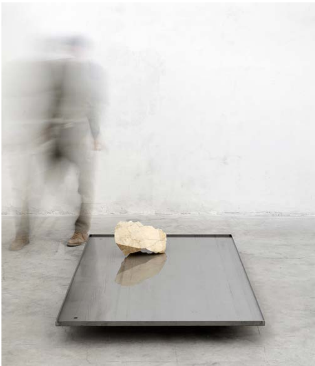
9 Sceso da una cava sul monte dentro lo zaino (pensando a Carlo Scarpa che pensava a Costantin Brancusi), 2017