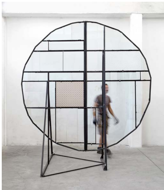
1 Rosone (186), 2017

Ho appeso a un muro un frammento di una lastra di marmo, con del gesso ne ho aumentato la superficie. Un telaio di metallo lo distanzia dalla parete rendendolo apparentemente leggero.